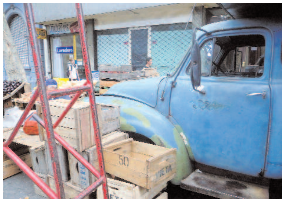
Nostalgie auf einem Markt in Montevideo