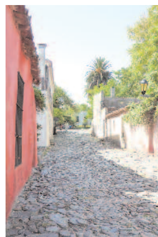
Hier ist die Zeit stehengeblieben: Gassen in Colonia del Sacramento in Uruguay.

Während sich in Deutschland die Diskussionen über eine Umweltpaket bis ins Lächerliche begeben, hat man rund 11.500 Kilometer von der Heimat entfernt die Zeichen der Zeit noch nicht erkannt und verpestet die Umwelt mit Fahrzeugen, die in Europa Museumszwecken dienen würden. Trotzdem gibt man sich in Argentinien