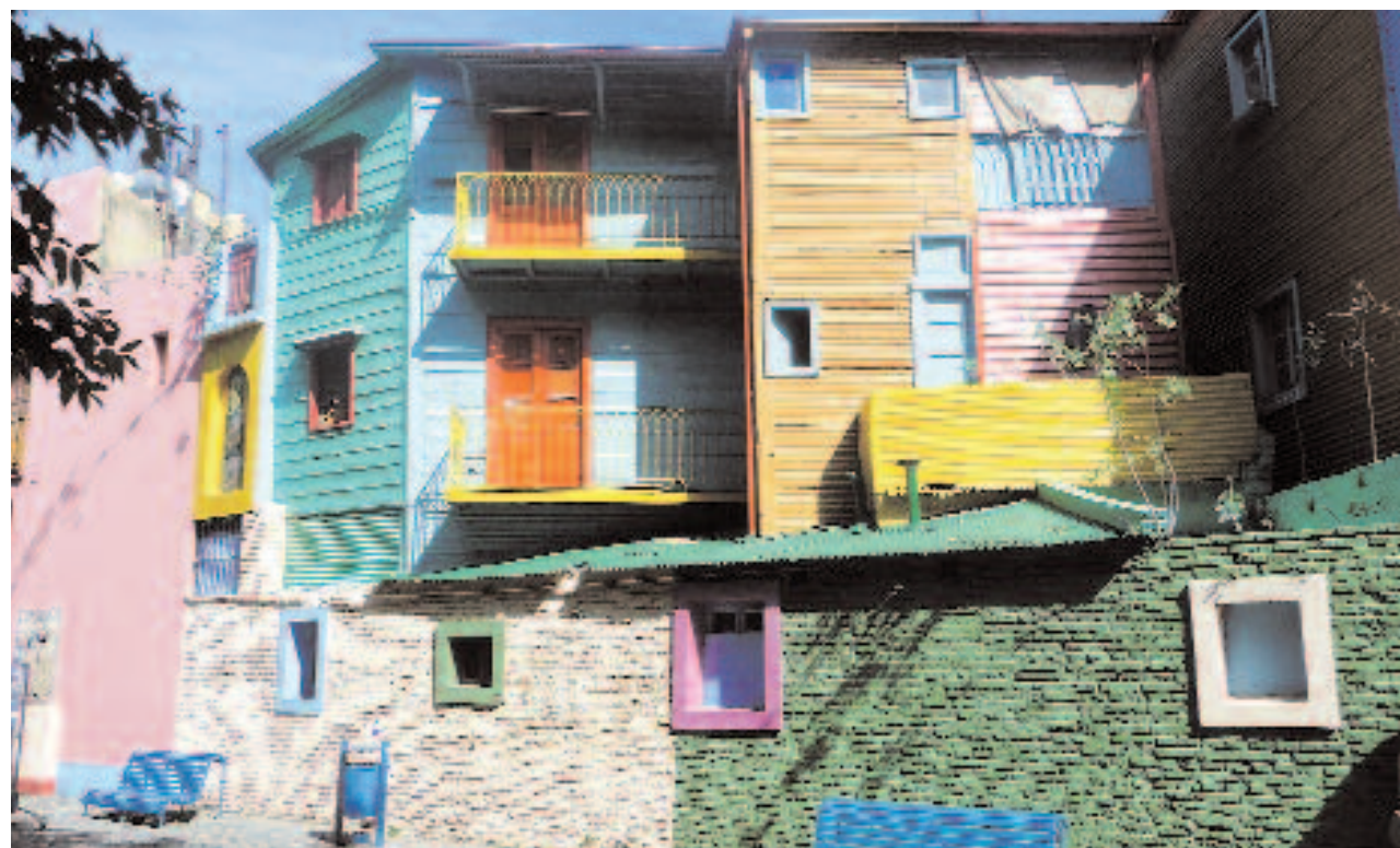
Markantes Bild in Buenos Aires: Die bunten Häuser auf der El Caminito im Stadtteil La Boca.

Wir fühlen uns im Großstadt-Dschungel von Tag zu Tag wohler und lernen