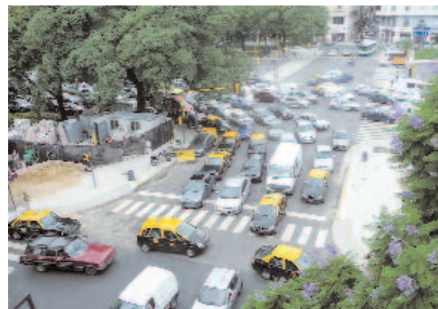
Alltägliches Verkehrschaos auf der Avenida 9 de Julio in Buenos Aires.

schnell, im Verkehr mitzuschwimmen. So haben Zebrastrifen außer der Verzierung des schwarzen Asphalt keine Bedeutung, die Fahrkünste der Argentinier funktionieren auch ohne Regeln und Rücksicht auf andere Verkehrsteilnehmer.