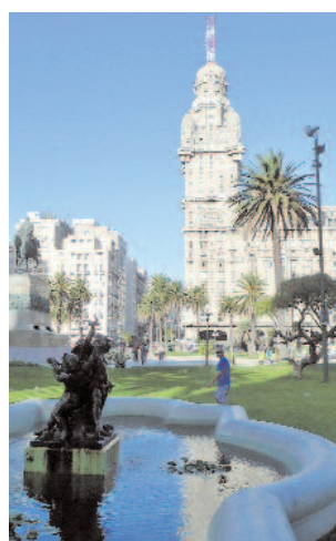
Beeindruckende Architektur bietet die Plaza Independencia in Montevideo.

sten Mal, wie es auf dem Land aussieht. Grün, so weit das Auge reicht. Bäume, hin und wieder ein paar Palmen, viele Kühe und immer wieder Grün. Dieses Bild ändert sich erst, als wir nach zweieinhalb Stunden Fahrt in der Hauptstadt ankommen. Mit ihren 1,5 Millionen Einwohnern ist die Stadt an der Mündung des Rio de la Plata in den Atlantik vergleichsweise überschaubar. Nicht weniger beeindruckend ist deshalb das Stadtbild.