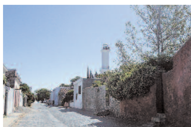
Die Altstadt des Städtchens Colonia del Sacramento in Uruguay gehört zum Weltkulturerbe der UNESCO.

Bei 30 Grad machen wir uns mit jeweils 30 Kilogramm Gepäck auf den Weg zum Hafen. Ungefähr fünf Kilometer, dann lassen wir uns von einem Taxi den restlichen Weg chauffieren. Der Urlaubscharakter soll schließlich nicht zu kurz kommen. Bei einem Fahrpreis von knapp